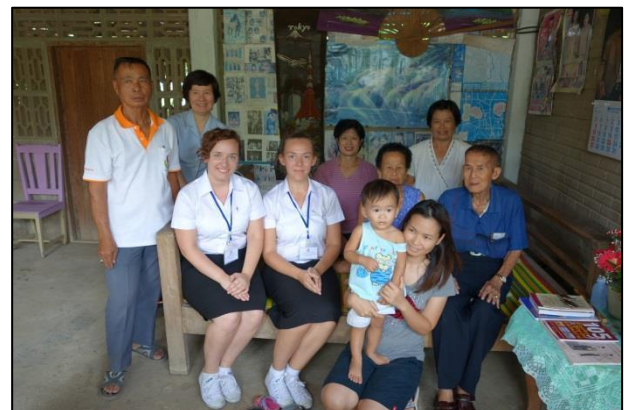
เรียนรู้เรื่องครอบครัวขยายในไทย