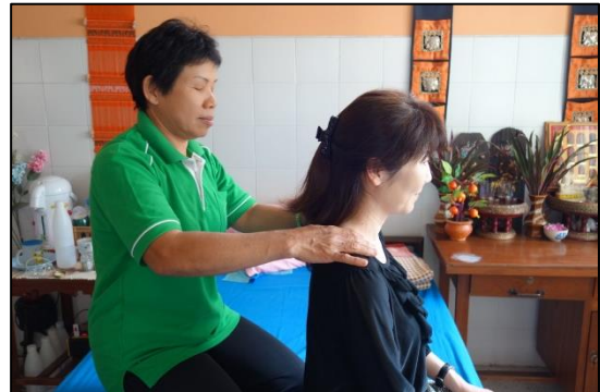
เรียนรู้เรื่องการดูแลผู้สูงอายุโดยผสมผสานวัฒนธรรมไทย