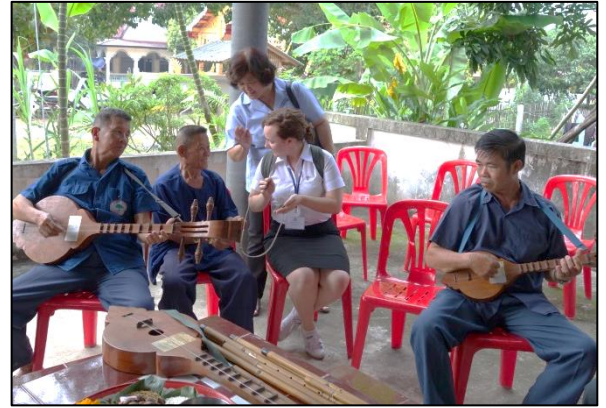
เรียนรู้เครื่องดนตรีไทย