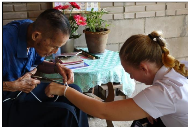
วัฒนธรรมการต้อนรับอาคันตุกะของผู้สูงอายุ