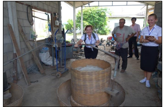
วิถีชุมชนเพื่อสร้างสุขภาวะ